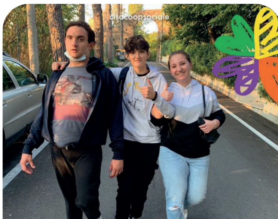
Il Filo dell'Amicizia

Nel corso dell'anno verrà realizzato un libro illustrato e un video che restituiranno l'esperienza vissuta dai ragazzi.